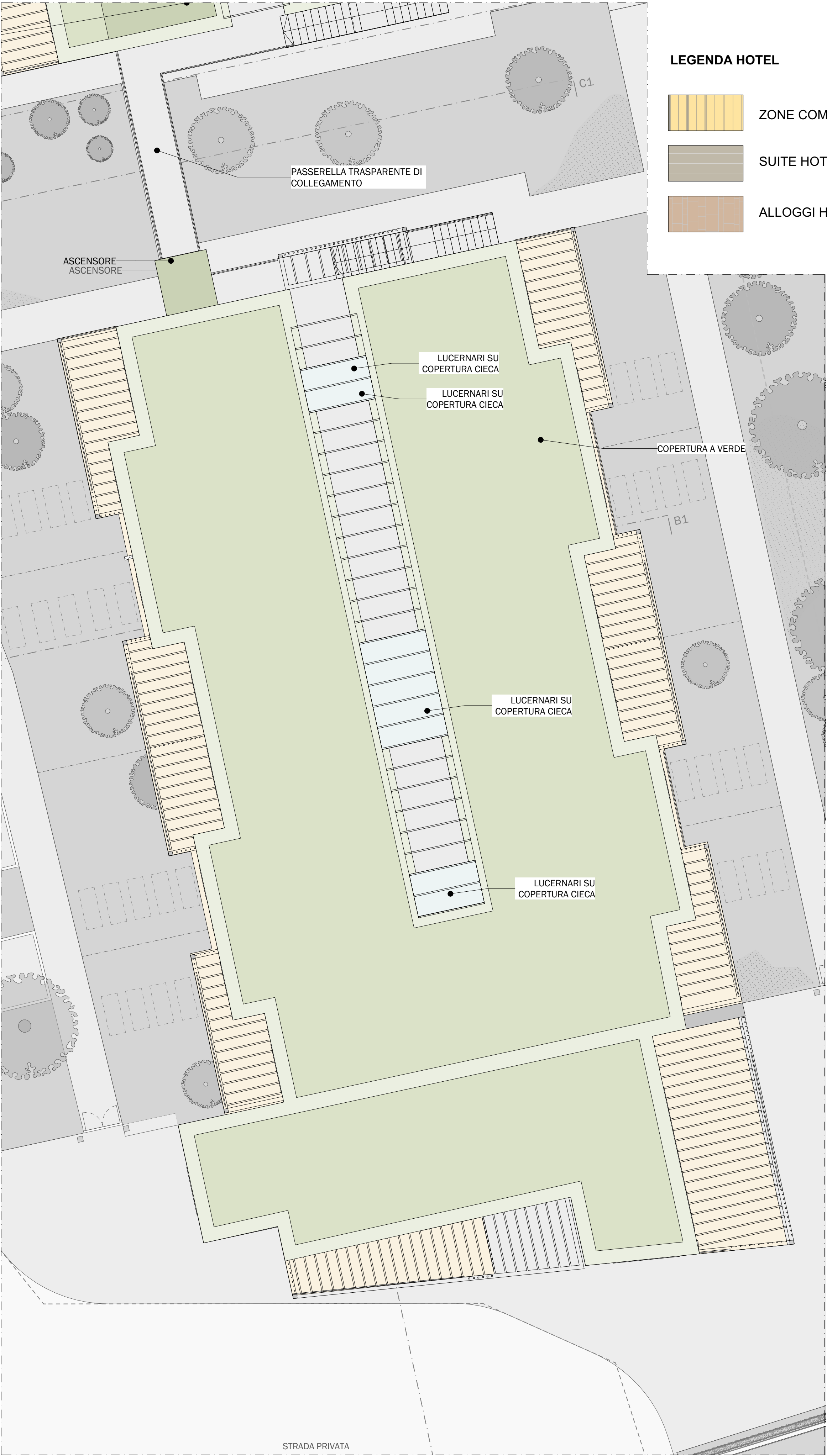
1. PIANO COPERTURE - CORPO A 1:100