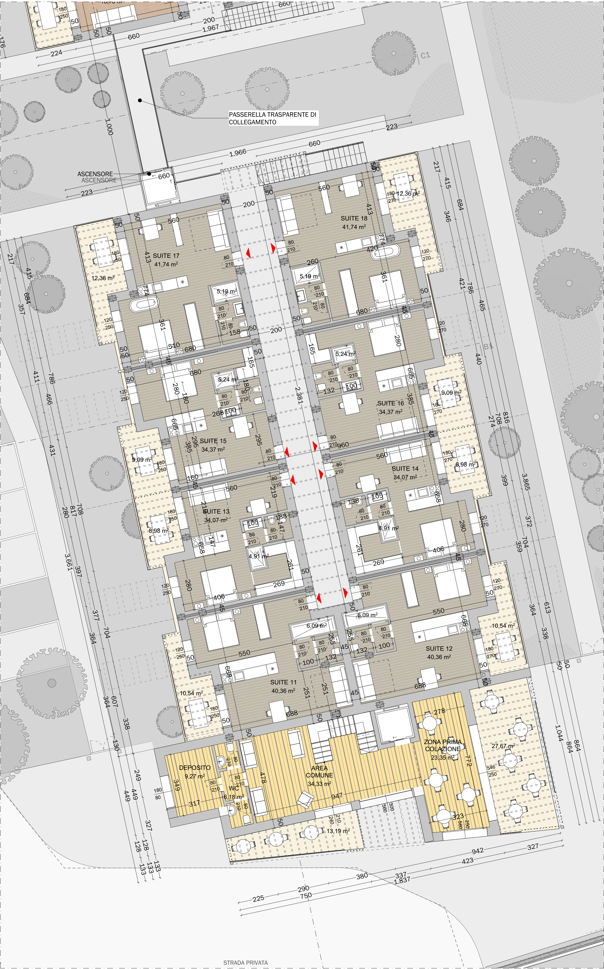
1. PIANO PRIMO - CORPO A 1:100